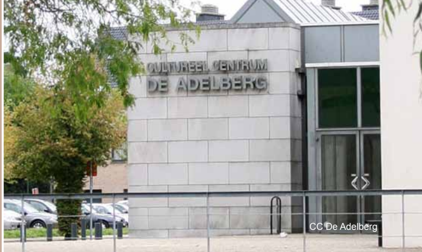
CC De Adelberg