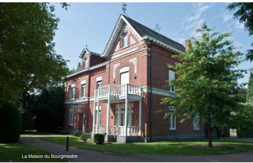
La Maison du Bourgmestre