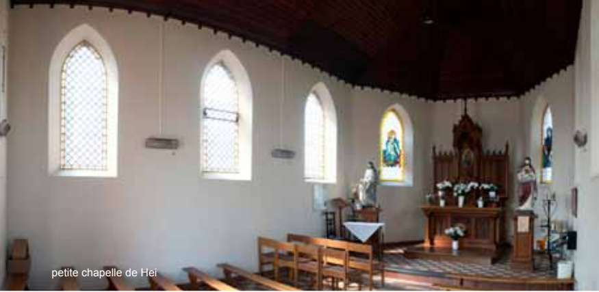
petite chapelle de Hei